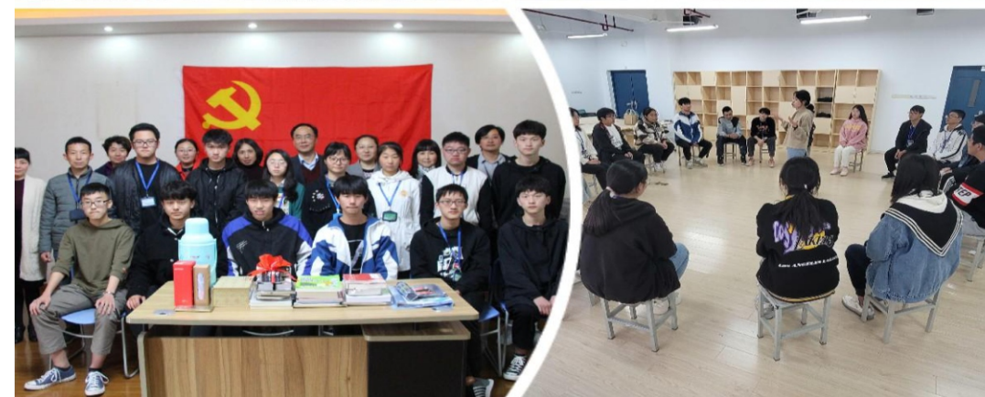
行为规范与习惯养成